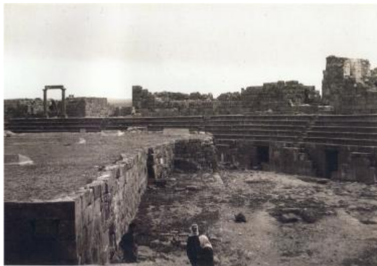
Le théâtre romain de Bosra. – L'un des plus vastes et des mieux conservés du Proche-Orient. Construit dans la seconde moitié du I er siècle de notre ère, il fut transformé en forteresse par les Musulmans de l'époque omayyade (VII e -VIII e siècles), ce qui protégea sa structure intérieure.

Trace de lumières, la photographie se révèle l'ambassadrice multilingue des patrimoines de l'humanité.