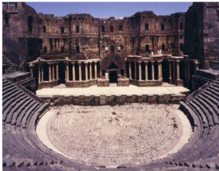
Bosra. – Au début du siècle, l'intérieur du théâtre était enseveli sous des tonnes de sable déposé par le vent au cours des temps. De longues années, entre 1947 et 1970, furent nécessaires pour dégager et restaurer l'ensemble, dont l'immense hémicycle (diamètre 81 m).