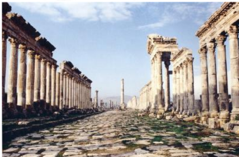
Apamée. – La Grande Colonnade en cours de reconstruction grâce à la Direction générale des Antiquités et des Musées de Syrie et grâce au Docteur Osmane Mounif Aïdi, homme d'envergure internationale.